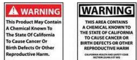
加州法案 65 标签示例